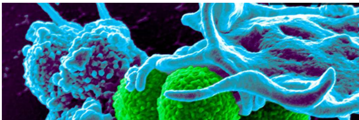
Obr. 2: Mikrograf zobrazujúci baktérie MRSA