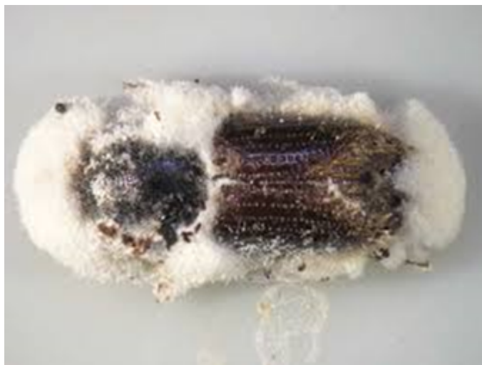
Obrázok č. 2 Napadnutie Ips typographus (lykožrút smrekový) entomopatogénnou hubou Beauveria bassiana (Vakula et al., 2009)