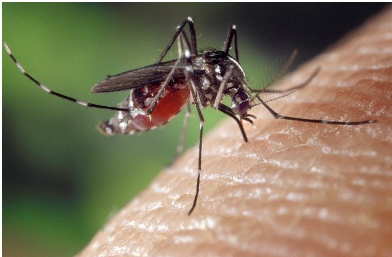
Aedes albopictus